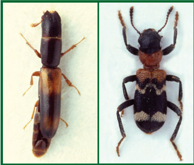
Predátoři lýkožrouta lesklého: vlevo kornatec dlouhý ( Nemozoma elongantum ), zvětšeno 14x, vpravo pestrokrovečník mravenčí ( Thanasimus formicarius ), zvětšeno 9x

Významné jsou i některé druhy dvoukřídlých (např. z rodu Medetera ) a blanokřídlých (např. chalcidka Psychophagus abieticola Ratz. nebo lumčici rodu Spathius , Ecphyllus a Cosmophorus ), jejichž larvy parazitují na vajíčkách, případně larvách I. lesklého. Na dospělých parazitují roztoči (např. Uropoda polysticta Vitzth.) nebo cizopasně hlístice (např. zástupci rodů Panagrolaimus nebo Parasitophelenchus ).