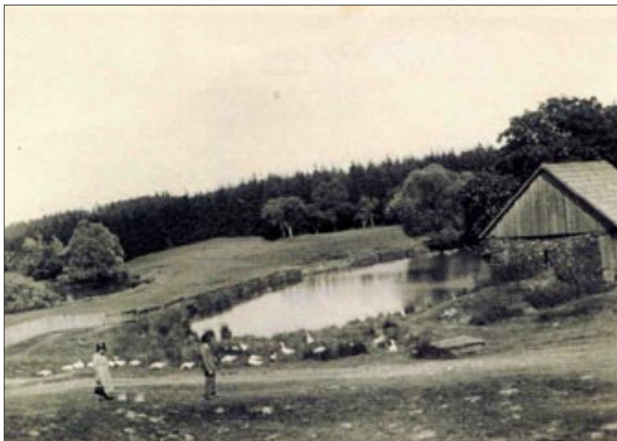
Kučerovo stavení 1942