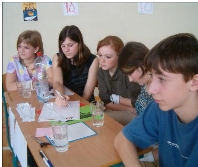
(Graficky zpracovala Štěpánka Peroutková, 9. třída)